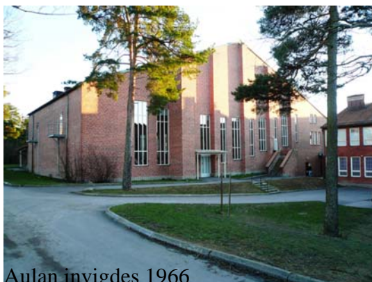
Aulan invigdes 1966