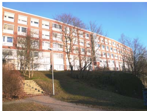
Stadshusets södra fasad