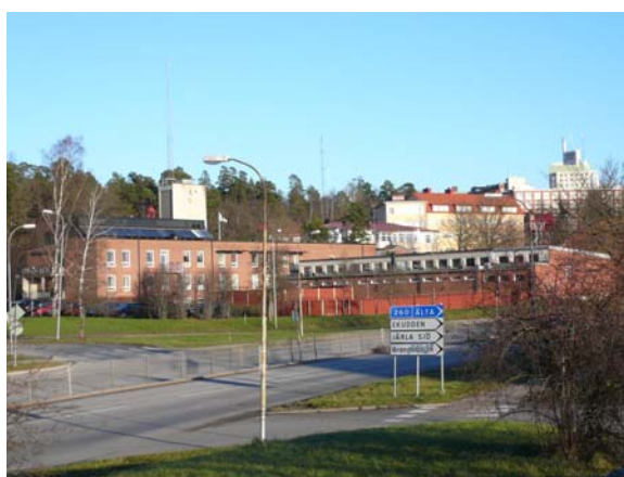
Järlahöjden med brandstationen i förgrunden, sett från söder