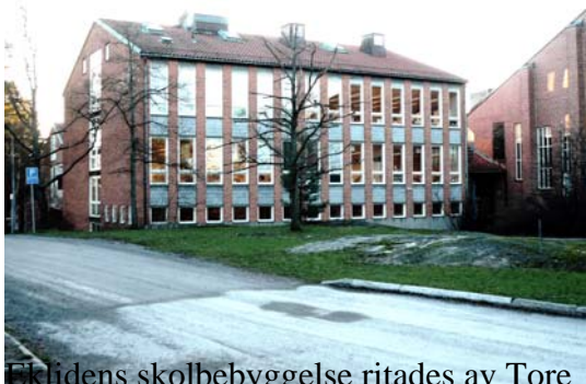
Eklidens skolbebyggelse ritades av Tore Axén i början av 1960-talet.