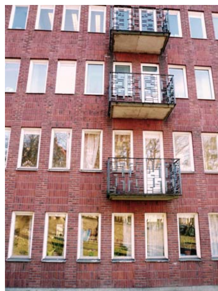
Detalj från Elverkshusets västra fasad