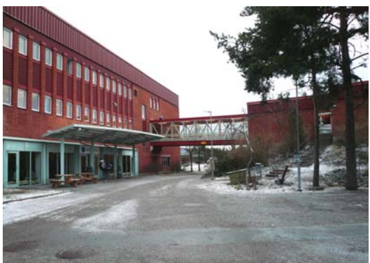
Nacka Gymnasiums kompakta bebyggelse tillkom på 1970-talet, strax väster om Ekliden skola.