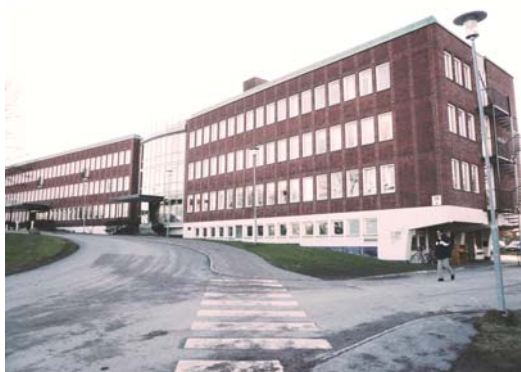
Stadshusets huvudfasad, mot norr