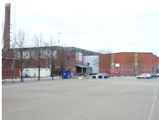
Huvudingången till Nacka sportcenter