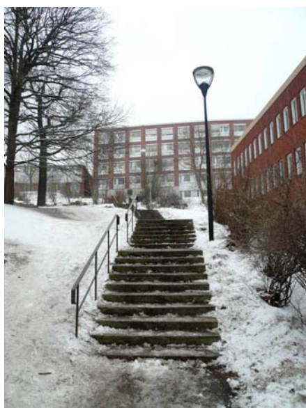
Stentrappan mellan Järla skola och Nacka Energi. I bakgrunden stadshuset