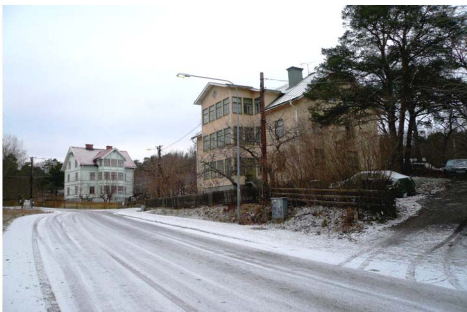
Egnahemsbebyggelsen i Järla-Birka är av skiftande karaktär och från olika perioder. Äldst är de flervåningsvillorna som tillkom 1890-talet medan de sista utbyggnadsetappen härrör från 1940-talet